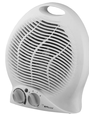
FH - 04 220V 50Hz 2000W