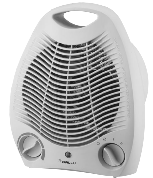
FH - 03 220V 50Hz 2000W